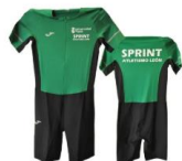
MONO HOMBRE COMPETICIÓN